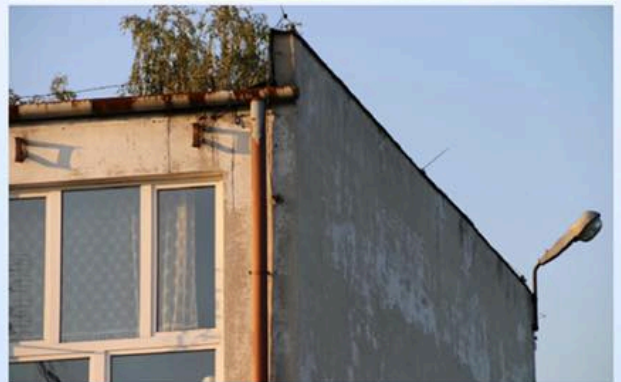
Zespół Szkół Zawodowych nr 3