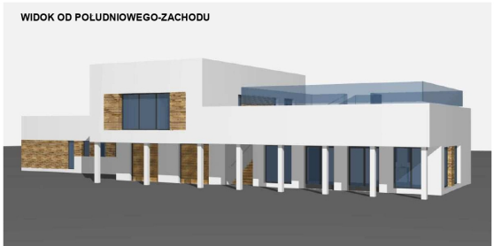
WIDOK OD POLUDNIOWEGO-ZACHODU