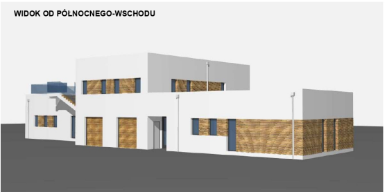
WIDOK OD PÓLNOCNEGO-WSCHODU