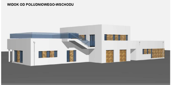
WIDOK OD POLUDNIOWEGO-WSCHODU