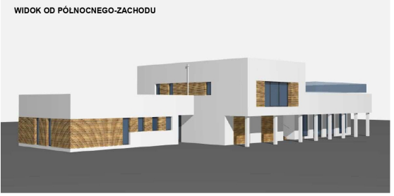
WIDOK OD PÓLNOCNEGO-ZACHODU