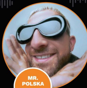
MR. POLSKA 2.09.2023 godz. 20:00

STREFA GASTRO STREFA PARTNERÓW MŁODZIEŻOWY ART PATROL STREFA AKTYWNOŚCI PARK ROZRYWKI