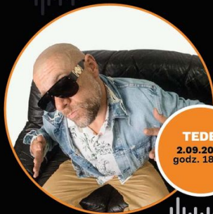
TEDE 2.09.2023 godz. 18:30