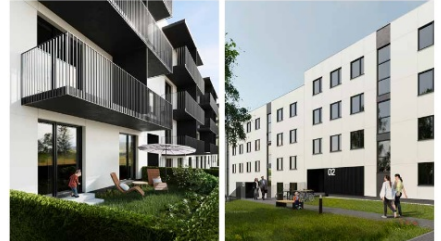
Zespół budynków mieszkalnych