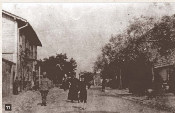
Zabudowa ulicy Starachowickiej (obecnie Piłsudskiego) w latach I wojny światowej