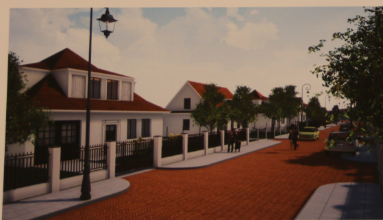
Projektowana zabudowa jednorodzinna wolnostojąca