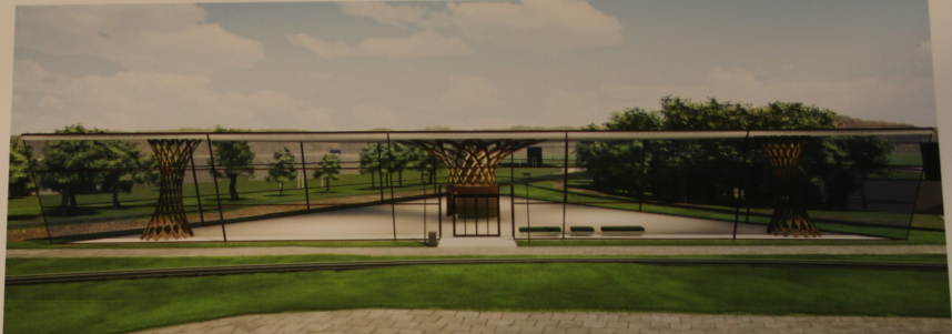
Elewacja pawilonu wystawowego