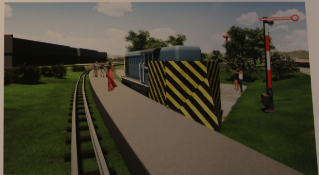
Peron osobowy z pługiem odśnieżnym