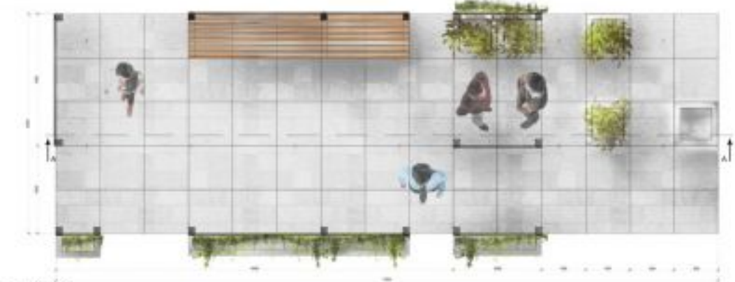
PLAN SKALA 1:20