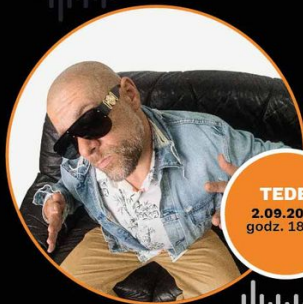
TEDE 2.09.2023 godz. 18:30