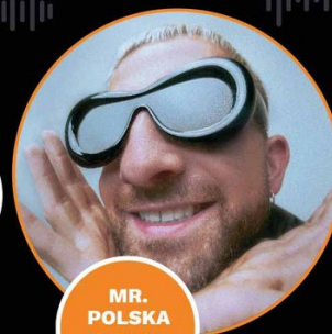
MR. POLSKA 2.09.2023 godz. 20:00

STREFA GASTRO STREFA PARTNERÓW MŁODZIEŻOWY ART PATROL STREFA AKTYWNOŚCI PARK ROZRYWKI