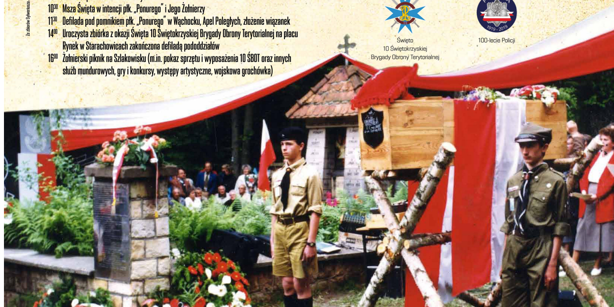
Wspieracie organizacyjnie i finansowo w organizacji uroczystości