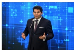
Lucjusz Nadberezny prezydent Stalowej Woli