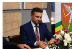
Michał Litwiniuk prezydent Białej Podlaskiej