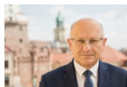
Krzysztof Żuk prezydent Lublina