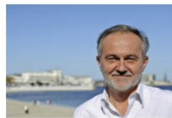
Wojciech Szczurek prezydent Gdyni

- Bardzo miłe informacje w niedzielny wieczór. Zostałem nominowany do