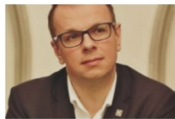
Wojciech Bakun prezydent Przemyśla