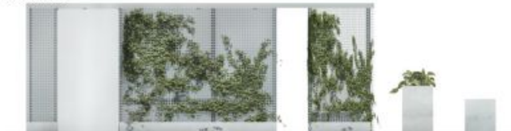
WIDOK POCZTYWY SKALA 1:20