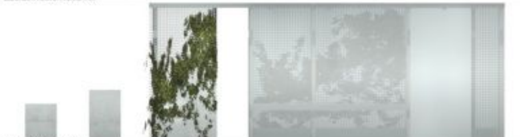
WIDOK TYLNY SKALA 1:20

II Miejsce (ex.) Praca nr 542862 - uzyskała w ocenie 418 punktów (na 600 możliwych)