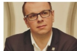
Wojciech Bakun prezydent Przemyśla