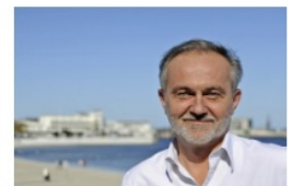
Wojciech Szczurek prezydent Gdyni

- Bardzo miłe informacje w niedzielny wieczór. Zostałem nominowany do