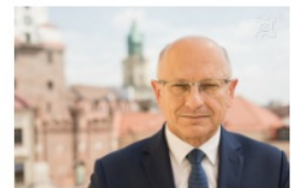
Krzysztof Żuk prezydent Lublina