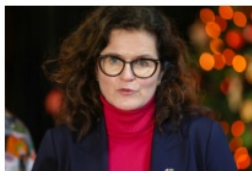
Aleksandra Dulkwicz prezydent Gdańska