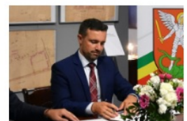
Michał Litwiniuk prezydent Białej Podlaskiej