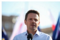
Rafał Trzaskowski prezydent Warszawy