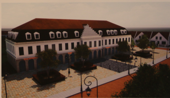
Projektowany plac miejski oraz Dom Kultury